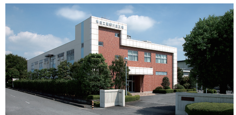
■ 川里工場 KAWASATO PLANT