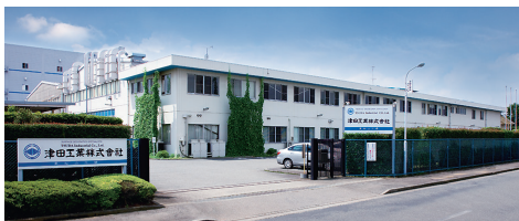
■ 東松山工場 HIGASHIMATSUYAMA PLANT