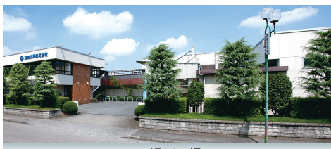
■ 滑川工場 NAMEGAWA PLANT

昭和41年 真空蒸着を専業とする津田工業株式会社を設立 資本金250万円 昭和45年 資本金を1,000万円に増資 隣接地を買収し、化粧品容器キャップの自動加工 ラインを建設 昭和51年 大手化粧品メーカー化粧品容器キャップの蒸着を 専業とする、吉見工場を開設 昭和52年 東松山工業団地に、本社社屋、本社メイン工場の建設 着工 昭和53年 資本金5,000万円に増資 本社(現滑川工場)竣工、操業開始 昭和54年 弱電部品へのスパッタリング加工の量産に入る 昭和56年 真空蒸着のUVハードコーティングラインを新設、直ち に量産に入る 昭和58年 シルク印刷部門を設立 文字抜き透光処理技術を確認 昭和60年 レーザー加工機を導入 平成 2年 川里工業団地に川里工場建設、稼働開始 平成 3年 生産能力10,000,000個/月となる 平成 4年 電磁波シールド加工着手 平成13年 東松山工業団地に東松山工場建設、稼働開始 平成18年 東松山工場に新ライン増設 平成21年 平成21年度さいたま輝き荻野吟子賞受賞 埼玉県あったか子育て企業賞平成21年度奨励賞受賞 子育てサポート企業「くるみん認定」初回取得 平成22年 大阪府東大阪市に大阪営業所を開設 平成24年 埼玉県多様な働き方実践企業、平成24年度ゴールド 認定 平成25年 子育てサポート企業「くるみん認定」2回目取得 均等・両立推進企業表彰(ファミリー・フレンドリー 企業部門)平成25年度埼玉県労働局長奨励賞受賞 平成30年 和歌山県紀の川市北勢田第2工業団地に紀の川工場 建設 平成31年 紀の川工場稼働開始 令和 3年 大阪府東大阪市長堂に大阪営業所を移設