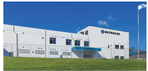
■ 紀の川工場 KINOKAWA PLANT