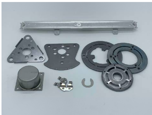
一般鋼・SUS・アルミ

様々な鋼材に対応でき、板厚は0.1mm~9.0mmまでの精密プレス加工が可能です。 複雑な形状や細いスリット形状でもプレス加工する型技術、加工技術を持っています。 ※HP上に保有プレス機、取扱い鋼材の記載があります。ご参照下さい。