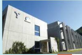
山梨大学 水素・燃料電池ナノ材料研究センター