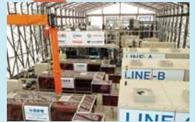
県企業局 米倉山電力貯蔵技術研究サイト