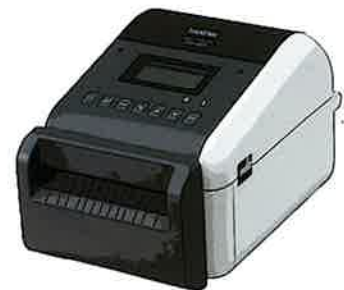
ラベルプリンター