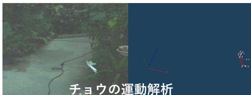
チョウの運動解析